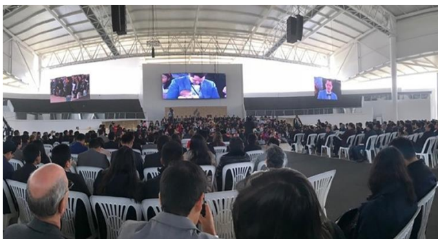
Участники XIII Библейско-богословского Южноамериканского симпозиума в Перу