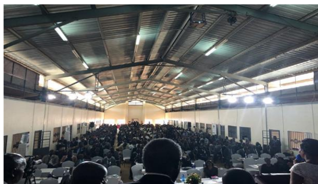
Участники Международной библейской конференции Южноафриканско- Индоокеанского Дивизиона в Замбии.

25-26 октября 2019 г. члены ИБИ совместно с другими докладчиками из Лома Линда приняли участие в VII Библейской конференции о Духе пророчества в Университете Монтеморелос в Мексике.