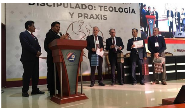
Докладчик на XIII Библейско-богословском Южноамериканском симпозиуме в Перу

10-14 сентября 2019 г. члены ИБИ совместно с другими докладчиками из Генеральной Конференции, Центра исследования трудов Элен Уайт и различных образовательных учреждений из Африки выступили на первой Международной библейской конференции Южноафриканско- Индоокеанского Дивизиона в Замбии. Темой библейской конференции были «Размышления об адвентистской теологии и практике в контексте Южноафриканско-Индоокеанского Дивизиона». В прекрасном кампусе Адвентистского университета Русунгу в Замбии несколько сот пасторов и руководителей церкви из различных стран дивизиона посещали пленарные заседания и множество семинаров.