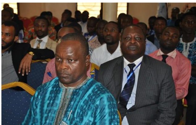
Участники Библейской конференции в Университете Валли Вью

С 26 по 28 мая 2019 года член ИБИ участвовал в выездном духовном семинаре для пасторов Шведского униона в Вастеранге, Швеция.