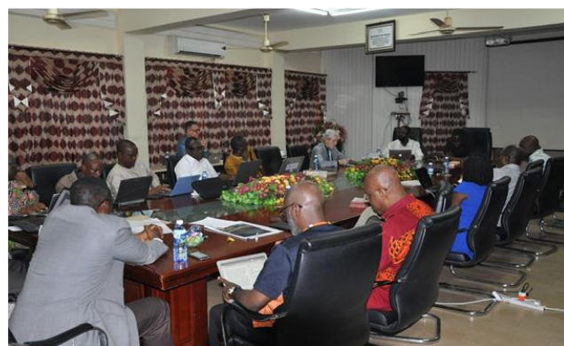
Университет Валли Вью

также работают над различными книжными проектами, которые служат особым нуждам Церкви адвентистов седьмого дня (к примеру, комитет ИБИ Интер-Европейского Дивизиона недавно опубликовал книгу «Адвентисты и служба в армии: библейский, исторический и этический взгляд» [Madrid: Editorial Safeliz, 2019]).