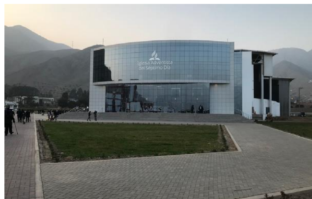
Прекрасная церковь в Universidad Peruana Union (UPeU)

31 июля – 4 августа 2019 года члены ИБИ совместно с другими богословами из Южной Америки участвовали и выступали на XIII Библейско-богословском Южноамериканском симпозиуме в Перу на тему «Ученичество: теология и практика».