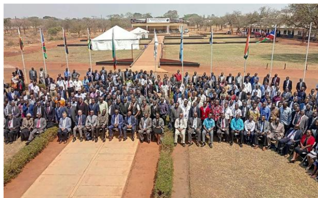
Участники Международной библейской конференции Южноафриканско- Индоокеанского Дивизиона в Замбии.

10-14 сентября 2019 г. члены ИБИ совместно с другими докладчиками из Генеральной Конференции, Центра исследования трудов Элен Уайт и различных образовательных учреждений из Африки выступили на первой Международной библейской конференции Южноафриканско- Индоокеанского Дивизиона в Замбии. Темой библейской конференции были «Размышления об адвентистской теологии и практике в контексте Южноафриканско-Индоокеанского Дивизиона». В прекрасном кампусе Адвентистского университета Русунгу в Замбии несколько сот пасторов и руководителей церкви из различных стран дивизиона посещали пленарные заседания и множество семинаров.