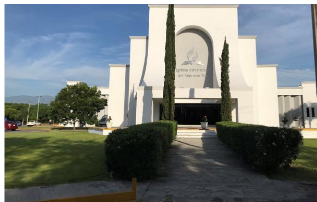
Главная церковь АСД на территории Университета Монтеморелос

3-6 июля 2019 года члены ИБИ и другие докладчики из Центральной и Южной Америки выступили с докладами на библейской конференции в Университете Монтеморелос в Мексике на тему святилища.