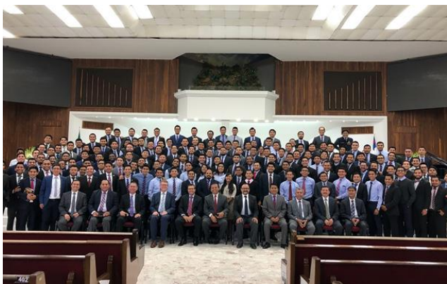
Пасторы и докладчики VII Библейской конференции о Духе пророчества в Университете Монтморелос.